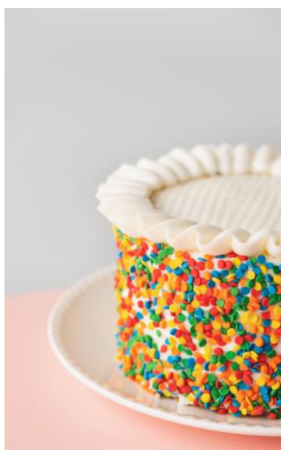
Votre talent : pâtisser, pâtisser et... pâtisser.