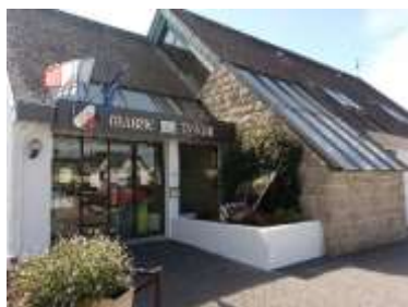
Mairie de Saint-Yvi